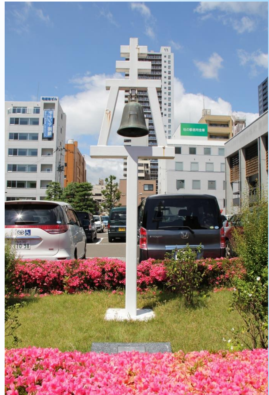
リバサイドの友好の鐘