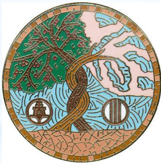
50周年記念バッジ（2007年）