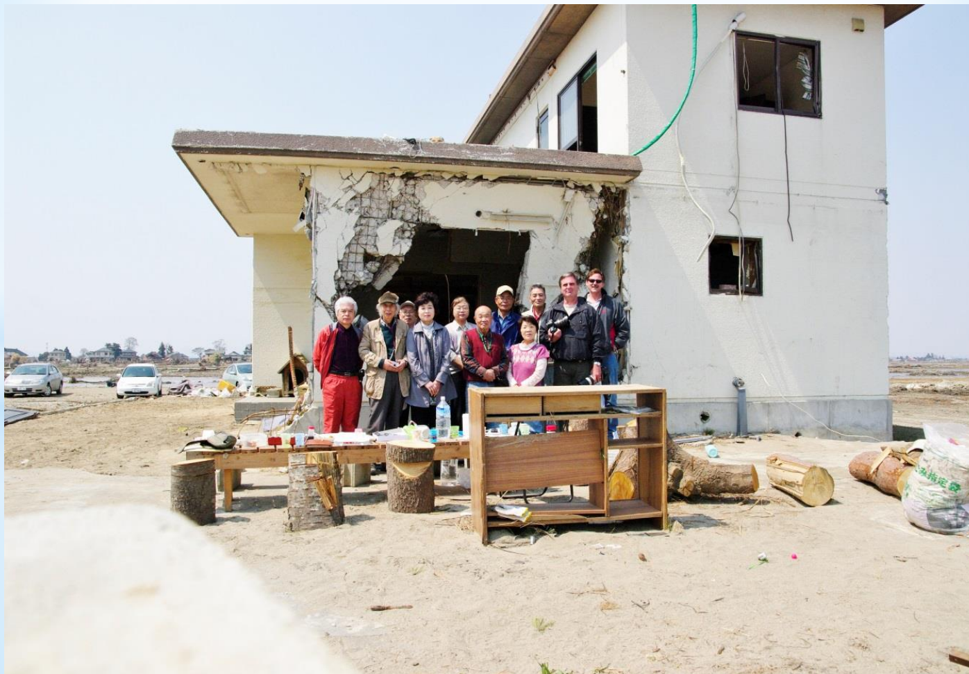
被災した住宅の前で

■2011年4月、リバサイドのプレス・エンタープライズ社の記者が、震災取材するため来仙しました。