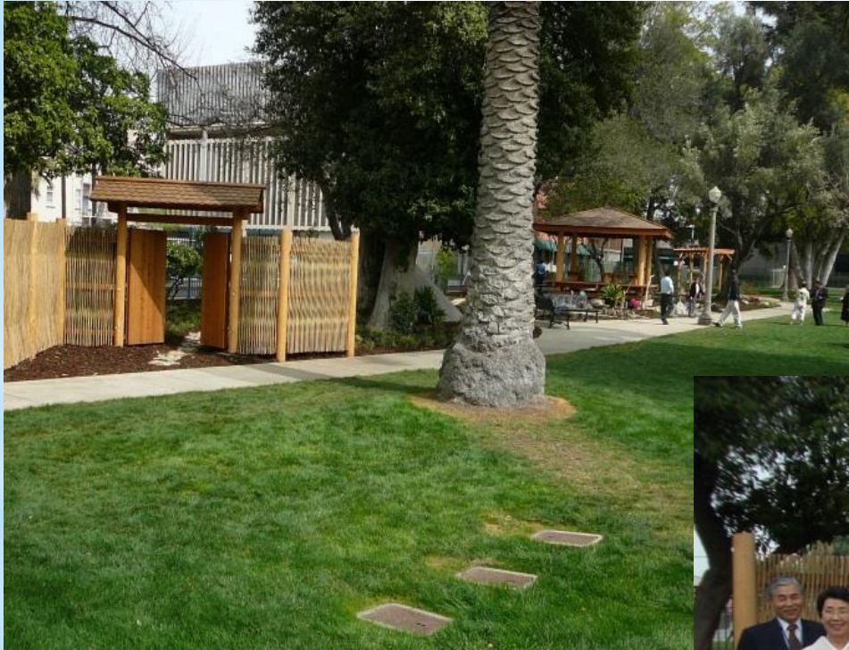
リバサイドの日本庭園

■2007年3月、50周年記念式典がリバーサイドで行われました。仙台の公式代表団がリバサイドを訪問し、日本庭園を贈呈しました。