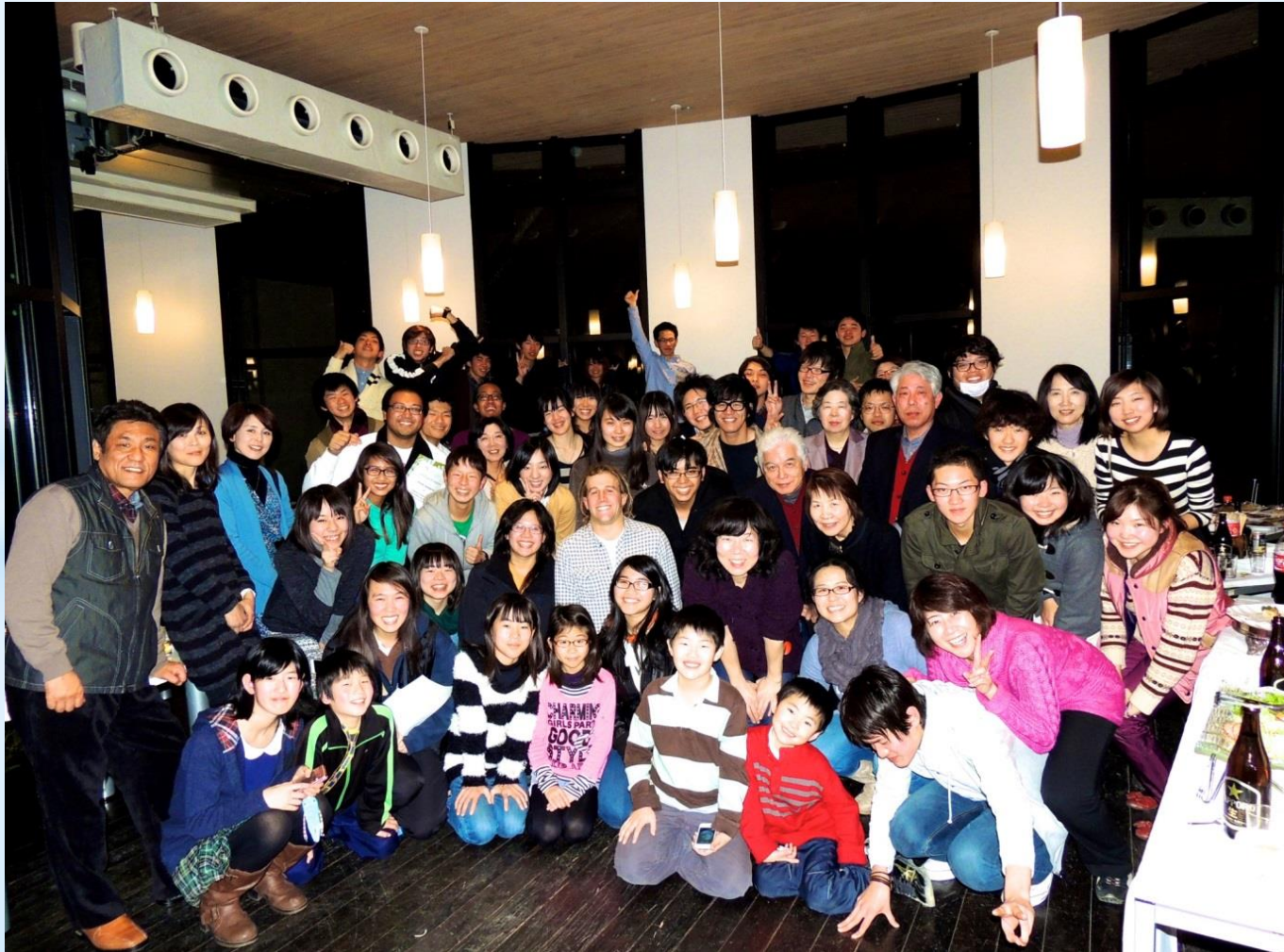
さよならパーティー

■年に2回、UCRの学生が仙台を訪問し、東北大学の学生と交流します。そしてホームステイを楽しみます。