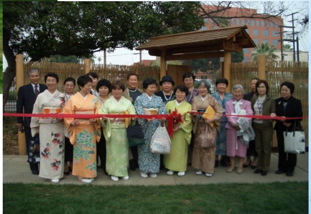
贈呈式におけるテープカット