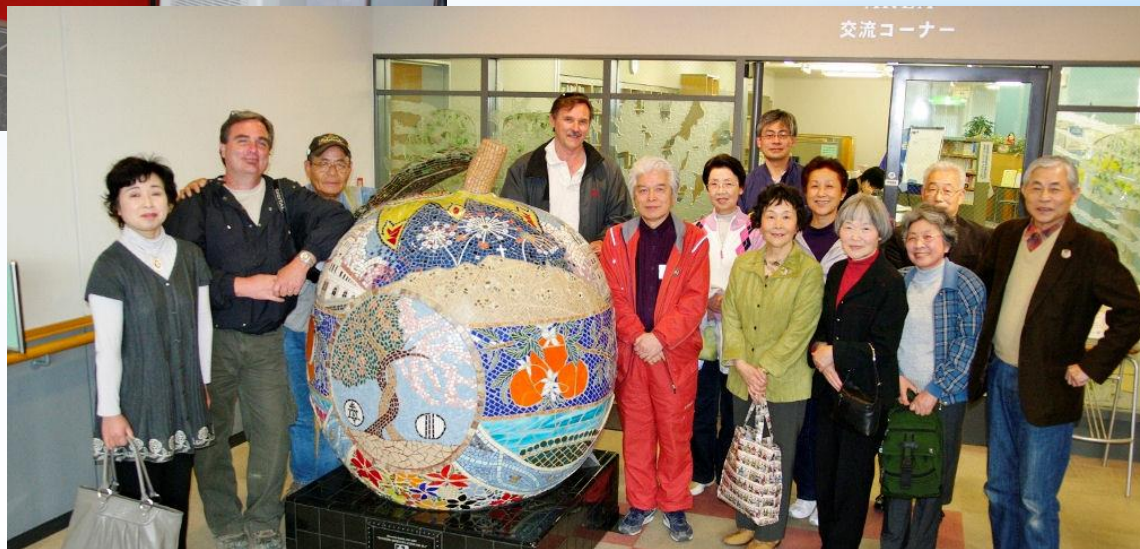
ジャイアントオレンジ