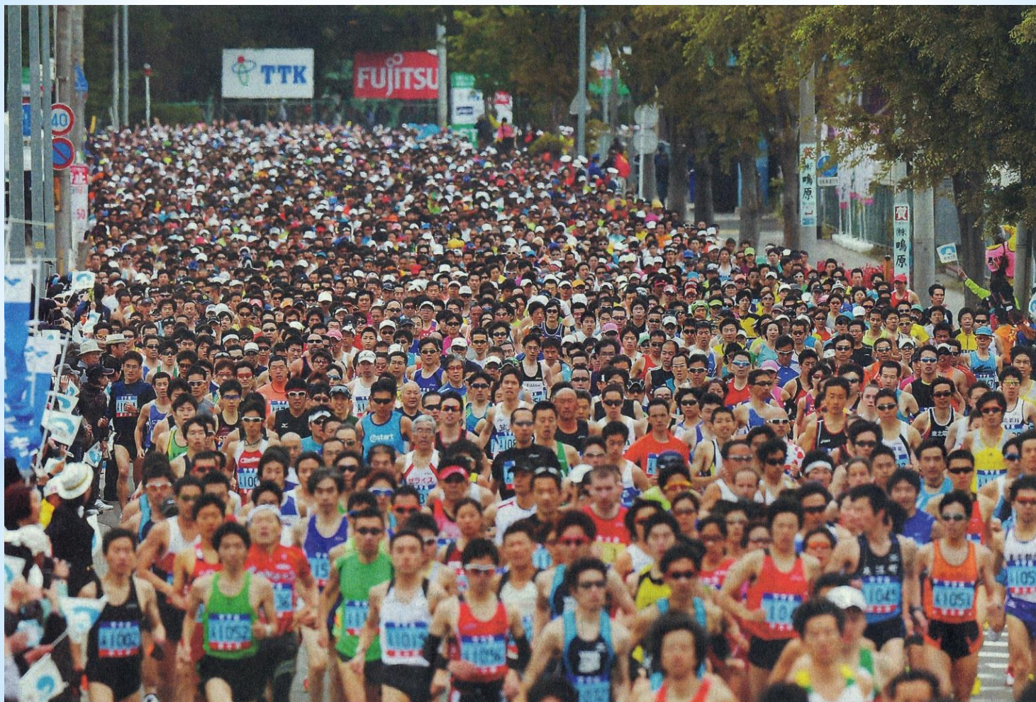
仙台国際ハーフマラソン大会